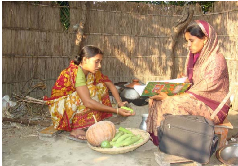
Ernährungsberaterin vermittelt Wissen um eine gesündere Zukunft für Mutter und Kind zu sichern

Gesundheitserziehung ist ein Bestandteil der wöchentlichen Treffen der