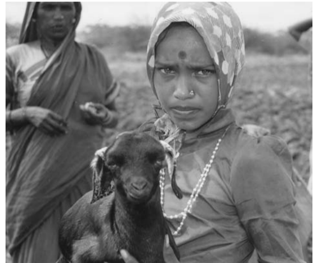
Schäferfamilie in Karnataka/Indien hoffen auf eine Chance für den Neubeginn

Unser Partner und seine Mitarbeiter, darunter auch Tierärzte und ausgebildete Veterinär-Assistenten, haben sich sofort mit einem unglaublichen Engagement um Schadensbegrenzung bemüht: Sie haben den Schäfern geholfen, über die lokalen Tierärzte Hilfe zu bekommen, haben mit Unterstützung der örtlichen Regierung Camps zur Untersuchung und Impfung der Tiere durchgeführt,