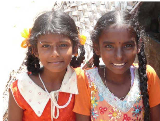
Ein Glück, dass diese Mädchen leben dürfen!

Mädchenötung ist rund um die Stadt Madurai eine gängige Praxis. Entweder werden die Mädchen bereits als Fötus abgetrieben, oder die Mädchen werden kurz nach der Geburt getötet. Grund für die Tötungen sind die hohen Mitgiftzahlungen, die die Eltern der Mädchen später an die Familien der Ehemänner zahlen müssen. „In unserem Dorf wurden die Mädchen auf 14 verschiedene Arten getötet, bevor wir uns in Frauengruppen organisiert haben“, berichtet eine Frau. Noch 1992 kam auf 3 Jungen im Dorf nur 1 Mädchen. Seitdem unser Partner ARD (Gesellschaft für ländl. Entwicklung) in den über 50 Dörfern Aufklärungsarbeit leistet, gibt es dort keine Mädchenötungen mehr. Allein seit 2004 sind in einem Dorf 200 Mädchen gerettet worden. Die Frauen unterstützen sich gegenseitig: „Hier wird jede Schwangere auf ihrem Weg begleitet und für jedes neugeborene Mädchen werden 2 Kokos-Palmen gepflanzt, nach 2 Jahren bekommen die Mädchen dann noch 3 Ziegen dazu. Die Erlöse aus der Ziegenmilch und den Kokosnüssen werden gespart und reichen für die spätere Aussteuer“. Mädchen sind jetzt wieder willkommen, sie spielen auf der Straße und gehen zur Schule – wie die Jungen!