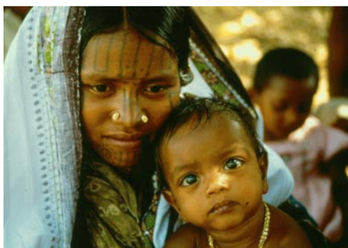
Mutter und Kind dürfen leben - keine Selbstverständlichkeit

Mädchen und Frauen brauchen Wissen und Selbstbewusstsein, um in Fragen der Partnerschaft, Sexualität, Gesundheit und Familienplanung mitzubestimmen. Unterernährung bei Kindern kann insbesondere durch integrierte (ländliche) Entwicklungsprojekte, die die Nahrungssicherheit und Stärkung der Rolle der Frau in den Vordergrund stellen, begegnet werden. Die Andheri-Hilfe Bonn unterstützt Projekte und Programme, um die Gesundheit von Babys, Kindern und Frauen zu schützen. Helfen Sie mit unter dem Stichwort: „Leben retten“!