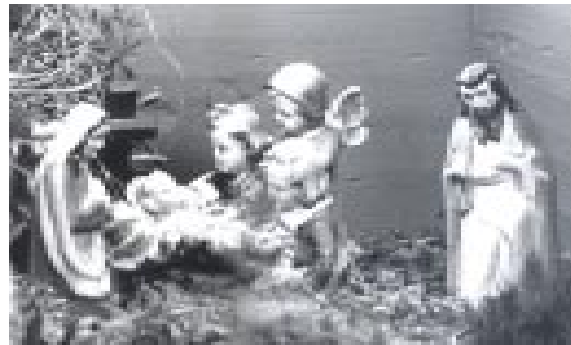
Ausschnitt aus der Weihnachtskrippe

Die Krippenmechanik wird von einem alten Fiat - Scheibenwischermotor angetrieben, alte Fahrradreifen, Flach- und Rundriemen, Kettenantriebe und Winkelgetriebe von ehemaligen Futtermaschinen anno 1910 wurden als Baumaterial eingesetzt. Es sind Haltepunkte, Drehbewegungen und Rückläufe eingebaut, die in ihrer technischen Perfektion und Einfachheit kaum zu