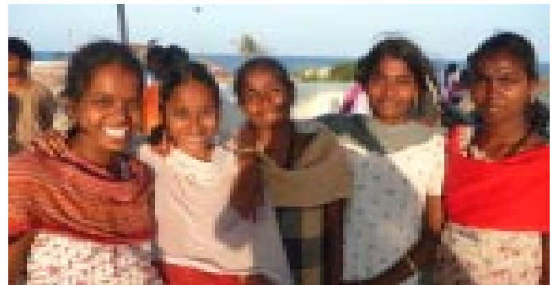
Töchter der Haushaltshilfen sind voller Zuversicht

In Chennai, der viertgrößten Metropole Indiens, ist es unserer Partnerorganisation CWDR gelungen, die Hausangestelltengewerkschaft Manushi zu gründen. Die Arbeit der Haushaltshilfen ist sehr oft eine Form moderner Sklaverei, versteckt in privaten Haushalten und durch kein Arbeitsrecht geregelt. Manushi ist eine Interessensvertretung von Frauen für Frauen. Wir unterstützen die Gewerkschaft mit Schulungen für die Mitglieder, Berufsbildungen für Frauen, beim Aufbau einer zentralen Arbeitsvermittlung und Kampagnen. Manushi soll die Frauen beraten, unterstützen und Rechtsbeistand geben. Die Gewerkschaft soll sich zu einer Anlaufstelle für Behörden und Öffentlichkeit entwickeln. Strukturelle Veränderungen auf Regierungsebene sind ein riesiger Erfolg: Tamil Nadu ist heute der erste und bisher einzige indische Bundesstaat mit einer Amtsstelle für Hausangestellte! BHJ