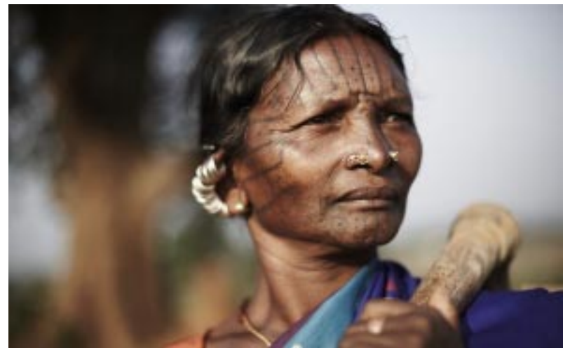
Adivasi kämpfen um ihre Rechte

Die Verabschiedung des Gesetzes zur Anerkennung von Waldrechten (sog. forest bill) durch das nationale indische Parlament im Dezember 2006 war ein Meilenstein für die Ureinwohner. Vier Jahre lang haben insbesondere Organisationen der Adivasi mit großem Engagement dafür gekämpft. Es dauerte ein weiteres ganzes Jahr bis das Gesetz mit konkreten Ausführungsbestimmungen tatsächlich in Kraft trat. In all den Jahren hat sich unser Partner Rajpipla Social Service Society gemeinsam mit den betroffenen Adivasi und mit zahlreichen Aktionen für das Gesetz eingesetzt. Allein in den von uns unterstützten Gebieten in Gujarat leben 2,5 Millionen Adivasi. Sie müssen über ihre neuen rechtlichen Möglichkeiten aufgeklärt werden und lernen, wie diese auch in die Tat umgesetzt werden können. BHJ