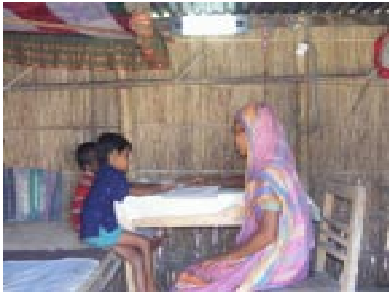
Kinder können nun auch am Abend noch lernen

ergie wurden im September 2008 674 weitere Haushalte identifiziert, die nun in den Genuss der Solarenergie kommen sollen. Damit erhöht sich die Gesamtzahl der Solarenergienutzer auf 1.088 Familien.