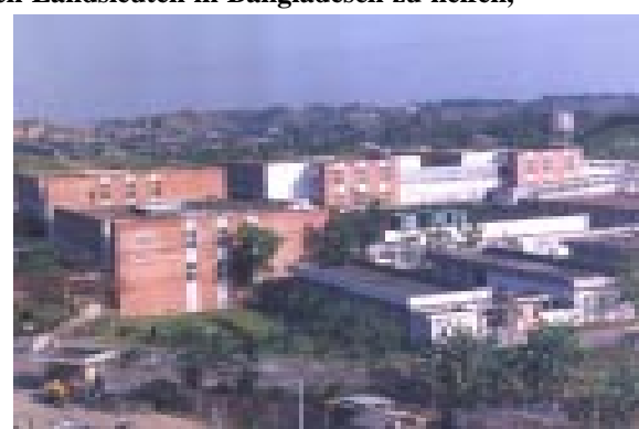
Augenhospital in Chittagong

Aus diesen Fremden wurden Freunde, aus der hoffnungslos erscheinenden Unsicherheit gezielte Programme. Die ersten Versuche der BNSB von Eye-Camps (mobile Augenbehandlungslager), um augenmedizinische Dienste in die Dörfer zu bringen, werden intensiviert. Neben dem behelfsmäßigen Augenkrankenhaus in Chittagong entstehen landesweit weitere Eye-Hospitals für medizinische Dienste im nahen Umfeld, vor allem aber als Basis, um die Augenkranken und Blinden in entlegenen dörflichen Regionen zu erreichen. Verhütung von Neuerblindungen steht gleichzeitig auf dem Programm, ebenso wie Hilfestellung bei nicht zu heilender Blindheit. Der Mangel