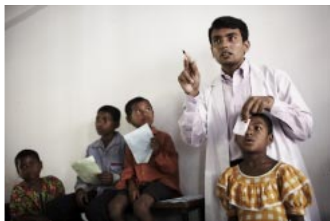
Sehtest in der Schule

Andheri-Hilfe bemüht sich, neben der bestehenden Partnerschaft mit der „Bangladesh National Society for the Blind“ weitere Verbindungen zu anderen professionellen medizinischen Einrichtungen herzustellen. Außerdem sollen noch mehr entwicklungspolitische Nichtregierungsorganisationen mit Augenärzten und spezialisierten Einrichtungen in Kontakt gebracht und Arbeitsbe-