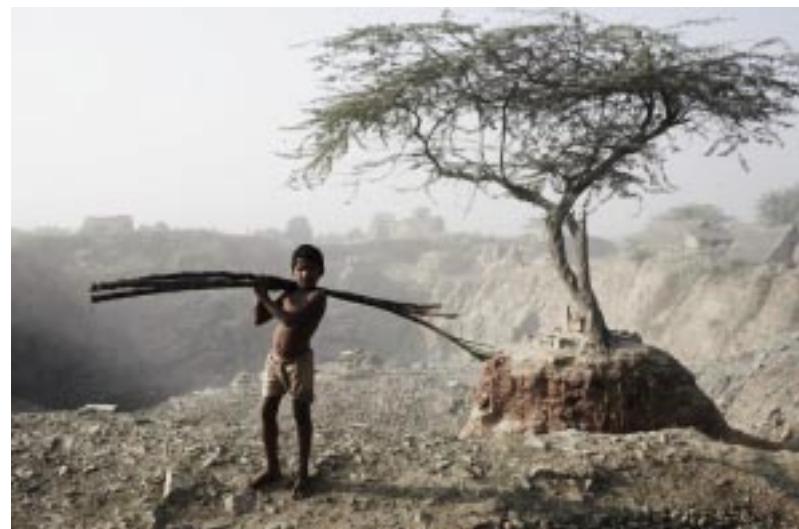
Junge in Steinbruch bei Chennai: