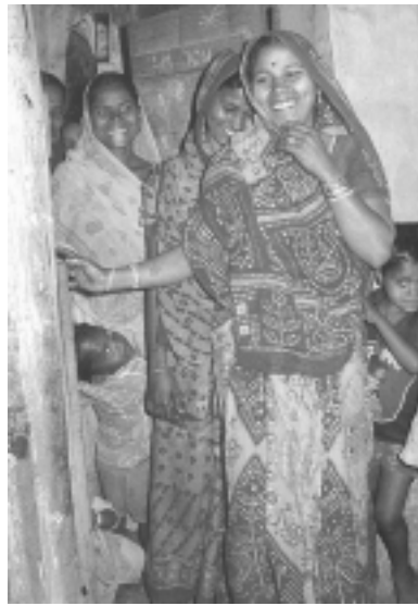
Kalenderblatt Juni 2007

Und die beliebten handgearbeiteten Weihnachts- und Glückwunschkarten aus Indien und Bangladesch können Sie gleich mitbestellen (auch telefonisch, per Fax oder E-Mail).