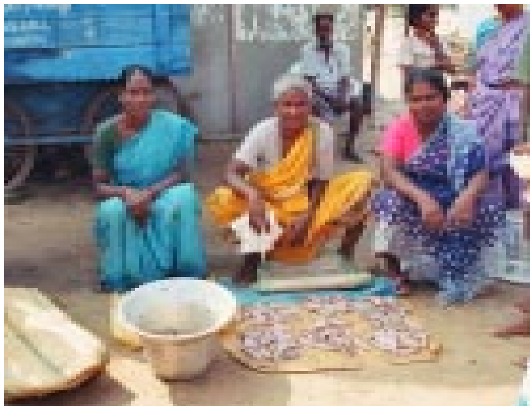
Dalitfrauen bieten ihren Fisch zum Kauf an

vom Geldverleiher. Während keine Bank diesen mittellosen Dorfbewohnern auch nur den kleinsten Kredit gewähren würde (Welche Sicherheiten haben sie schon zu bieten? Und einem Unberührbaren, einem Kastenlosen gibt man sowieso kei-