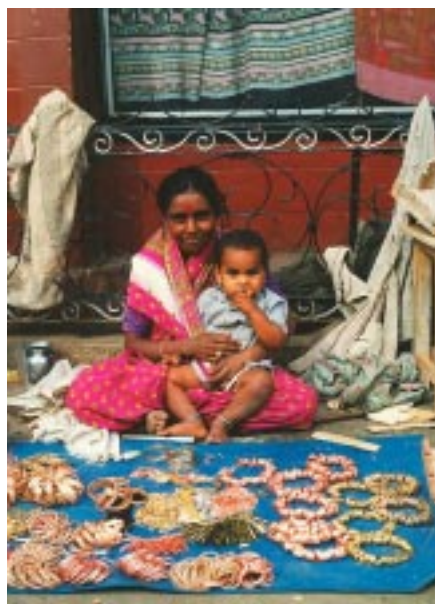
Mit einem Mikrokredit zum erfolgreichen Kleinunternehmen

Auch in den Projekten der Andheri-Hilfe spielen solche Kleinkredite eine wichtige Rolle. Genau wie die Grameen Bank setzten auch die Partner der Andheri-Hilfe vor allem auf die