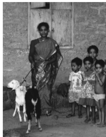
Zwei Ziegen sind der Grundstock für die Zukunft dieser Dalit-Familie