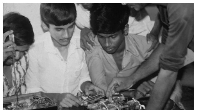
Berufsausbildung schafft Zukunftschancen

Täglich kommen in Villupuram Kinder an, die ihr Zuhause verlassen haben, sei es wegen extremer Armut, Gewalt oder Tod der Eltern, um nur einige Beispiele zu nennen. Sie kämpfen auf der Straße Tag für Tag um ihr Überleben. Für sie haben wir gemeinsam mit unserem Partner ein einfaches Zentrum eingerichtet: Hier können sie erstmals wieder in Sicherheit übernachten. Sie können sich waschen und ihre Mahlzeiten kochen. Gemeinsam mit den Projektmitarbeitern (einige von ihnen selbst ehemalige Straßenkinder) planen sie ihre Zukunft: Manche können (mit entsprechender Hilfestellung) doch wieder zu ihrer Familie zurückkehren. Andere wollen zur Schule gehen oder eine Berufsausbildung absolvieren und werden dabei unterstützt. Sie haben auch eine eigene Theatergruppe gegründet: In Slums und Dörfern „spielen“ sie ihr eigenes Schicksal, rütteln die Menschen auf und motivieren sie, sich für die Förderung von Straßenkindern und Kinderarbeitern einzusetzen.