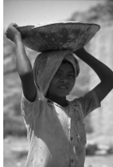
Zehnjähriger Bauarbeiter in Indien

Zum weitaus größten Teil arbeiten Kinder im „informellen“ Sektor, d.h. für sie gibt es keine Arbeitsverträge, keine festgesetzten Arbeitszeiten oder Löhne, keine Kontrolle über die Einhaltung gesetzlicher Mindeststandards. Damit sind sie in der Mehrzahl der Fälle schutzlos der Willkür ihrer Arbeitgeber ausgesetzt.