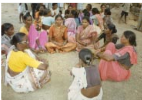
Erstmals dürfen Frauen offen diskutieren

In Kappoor (und nicht nur dort) machen Trommler lautstark die Runde und laden zum Theaterspiel am Abend ein: eine Attraktion und alle kommen. Im Spiel geht es dann darum zu zeigen, wieso Bildung so wichtig ist. Ohne erhobenen Zeigefinger wird hier manch wichtiger Denkanstoß gegeben, manch wertvolle Diskussion initiiert.