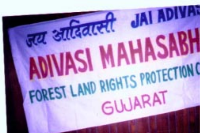
Öffentliche Anhörung in Neu-Delhi zu Landrechten von Adivasi