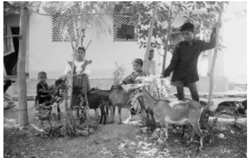
Das beste Heim kann eine Familie nicht ersetzen

Immer mehr gehört das Betteln für die Bewohner von Paul-Nagar der Vergangenheit an. Die landwirtschaftliche Nutzung des erworbenen Landes und die Viehhaltung,