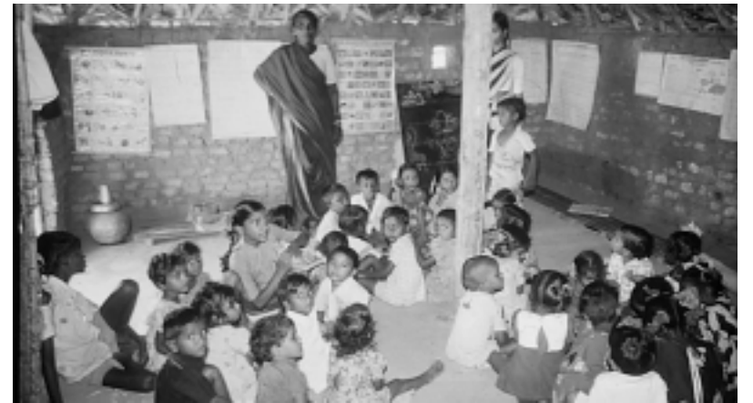
Kindergärten führen zur Schulbildung hin

Kinderarbeiter haben meist nie eine Schule besucht – oder diese sehr bald wieder abgebrochen. Diese Mädchen und Jungen können – selbst wenn sie ihre Arbeit aufgeben – nicht von Heute auf Morgen in reguläre Schulen integriert werden. So bietet unser Partner angepasste Bildung (Non-formal Education) in den Slums und Dörfern an: Hier wird am Abend Unterricht für arbeitende Kinder angeboten. Auch wenn sie erschöpft sind von der Arbeit des Tages, so sind sie doch glücklich, wenigstens ein wenig lernen zu dürfen. Wo immer möglich, werden diese Kinder so vorbereitet, dass sie nach einer gewissen Zeit in die lokalen Schulen aufgenommen werden können. Gleichzeitig wird hier Nachhilfeunterricht für die Schulkinder geboten, um zu verhindern, dass diese die Schule frühzeitig abbrechen. Überrigens findet dieser Unterricht meist einfach im Freien statt, unter einem Baum oder an einer Straßenecke im Slum. Bis zu 100 Kinder sitzen hier und lernen – unter primitivsten Bedingungen. Die motivierten Lehrer werden unterstützt von Jugendlichen aus den Dörfern bzw. Slums, die eine weitergehende Schulbildung genießen konnten. So kann in Kleingruppen von 7-10 Schülern sehr erfolgreich – und mit Freude – gearbeitet werden.