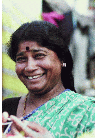
Kalenderblatt Mai 2010

„Die Megastädte in den Entwicklungsländern wachsen bedrohlich. Gleichzeitig wachsen die Slums. Immer mehr Menschen, zu meist auf der Suche nach Überlebenschancen, landen hier. Sie leben unter unwürdigen Bedingungen. Schaffen wir es, mit unserer Perspektive (vom Lateinischen perspicere, d.h. wörtlich übersetzt: mit Blicken durchdringen) deutlich wahrzunehmen - etwa die Lebenssituation der Frauen? Ihr Kampf um Würde und Rechte ist von uns aus nur „perspektivisch“ zu verstehen, ihr Erfolg erreicht nur in perspektivischem Verstehen unsere Bewunderung und unsere Anerkennung.“