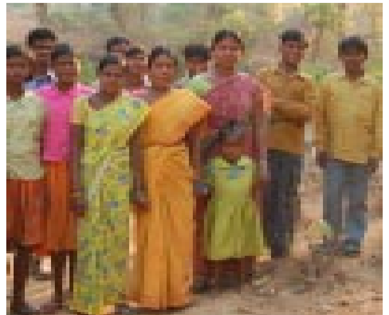
Indische Männer unterstützen ihre Frauen: keine Selbstverständlichkeit

Da Frauen in Indien unterdrückt werden, als Menschen zweiter Klasse gelten, werden diese gezielt in unseren Projekten gefördert. Viele Projektmaßnahmen haben direkte Auswirkungen auf das Leben der Frauen. Frauen haben in der indischen Gesellschaft bislang kein Mitspracherecht. Sie müssen ihrem Ehemann bedingungslos gehorchen, werden unterdrückt und dürfen nicht an Dorfversammlungen teilnehmen, wo wichtige Entscheidungen getroffen werden, die auch Frauen direkt betreffen. Daher ist es wichtig, dass bei der Durchführung von Projekten genau darauf geachtet wird, dass die Belange von Frauen berücksichtigt werden. Sie sind es zum Beispiel, die Wasser aus dem Dorfbrunnen holen und lange Wege schleppen müssen. Dass in der Vergangenheit Männer über den Standort des neuen Dorfbrunnen entschieden haben, hat den Frauen oft nicht geholfen. Da sich in Indien Frauen in Gegenwart ihrer Ehemänner nicht öffentlich äußern, ist eine Einbeziehung in die Projektarbeit anfangs oft nur möglich, indem separate Frauengruppen gebildet werden. Hier können die Frauen ihre eigenen Wünsche und Vorstellungen von Entwicklung einbringen und diskutieren. Die Projektmitarbeiter müssen aber bei der Durchführung der Maßnahmen genau darauf achten, dass die Wünsche der Frauen auch beachtet werden. Es darf nicht passieren, dass dann bei der Umsetzung