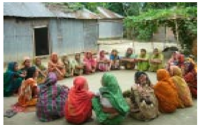
Starke Frauen verändern ihr Umfeld