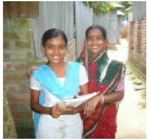
Auf dem Weg in eine bessere Zukunft

In Lalmonirhat: Hier haben Frauen den örtlichen Gemeinderat „belagert“ und später Gespräche mit den Gemeinderatsmitgliedern geführt. Dem obersten Verwaltungschef auf Kreisebene wurde ein Memorandum übergeben, in dem eine ordnungsgemäße Verteilung des Landes angemahnt wird. Das Engagement zahlt sich aus. Schon haben die ersten Landlosen Land erhalten. Überall in Bangladesch entstehen Selbsthilfegruppen. Aus ihnen gehen starke, dynamische, ausdauernde Führungspersönlichkeiten hervor - Frauen, die noch vor Kurzem unterdrückt, unterschätzt, unterworfen wurden. Lokale Machtstrukturen werden positiv unterfüttert. „Good Governance“ an der Graswurzel mit Auswirkungen auf die nachfolgenden Ebenen ist hier kein theoretisches Konzept, sondern gelebte Wirklichkeit. MPH