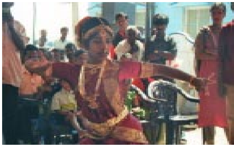
Anmutiger Tanz einer jungen Frau

Der Gesundheitszustand der Devadasis und ihrer Kinder ist meist schlecht, viele leiden an HIV/AIDS, wodurch sie noch weiter an den gesellschaftlichen Rand gedrängt werden. Obwohl die Tempelprostitution offiziell von der indischen Regierung verboten ist, wird sie dennoch häufig praktiziert. Hier setzt unser Partner SNEHA an: in 50 ausgewählten Dörfern finden u. a. Schulungen für Dorfbewohner, Regierungsbeamte, Juristen, Medienvertreter und Polizei statt. Die Menschen werden auf