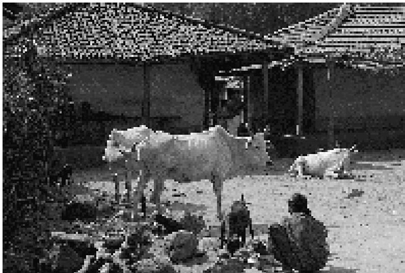
Kühe sind nicht „nur“ heilig in Indien

Büffel- und Ziegenzucht bieten weitere Möglichkeiten, insbesondere durch den Verkauf der erzeugten Milch über die Milchkooperative. Besonders bemerkenswert ist, dass bis zum Abschluss des Projekts eine starke Eigeninitiative der Frauen gewachsen ist, die dafür sorgt, dass weitere positive Entwicklungen – auch nach dem offiziellen Projektende – zu verzeichnen sind. So funktionieren z. B. heute sämtliche Zusammenschlüsse selbstständig und die Zahl der Frauengruppen ist weiter angestiegen. Die Milchkoopera-