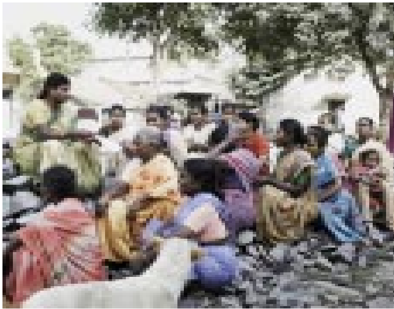
Konferenzraum - ein Steinhaufen

Unterstützt werden sie dabei von der Frauen-Föderation „Rural Women Development Federation“, die in einem vorhergegangenen Projekt der Andheri-Hilfe in Kooperation mit derselben Partnerorganisation aufgebaut wurde. Die Frauen der Föderation arbeiten mittlerweile vollkommen selbstständig und wollen die Frauen in der aktuellen Projektregion mit aller Kraft unterstützen. Dies geschieht folgendermaßen: Es werden zahlreiche neue Frauen-Selbsthilfegruppen gegründet. Den Mitgliedern der neu organisierten Gruppen sollen Denkanstöße gegeben sowie Planungs- und Handlungsmöglichkeiten dargelegt werden, für ihre Freiheit und Selbstständigkeit zu kämpfen. Schulungen vermitteln ihnen das nötige Handwerkszeug.