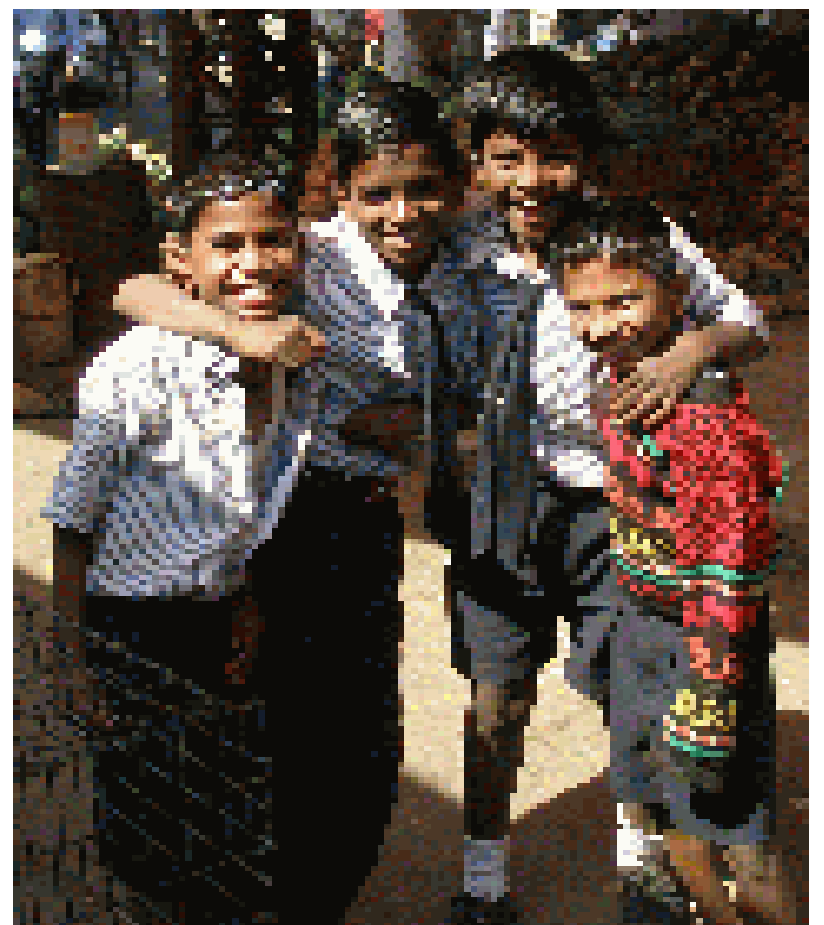
Schule kann auch schön sein

Doch seit Anfang August 2009 ist dies nun anders: mit dem Gesetz für Kinder zur Schulpflicht hat nun jedes Kind in Indien, zumindest offiziell, ein Recht auf Bildung in Form eines kostenlosen Schulbesuches.