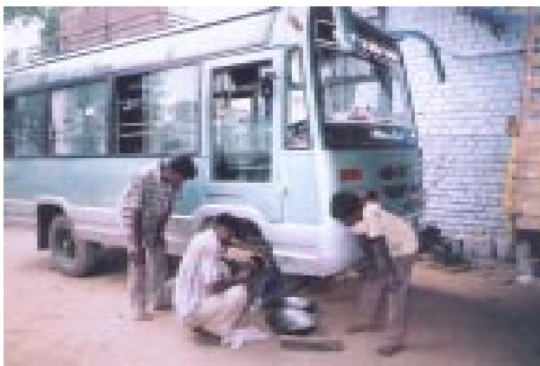
Jugendliche reparieren einen Bus

Wer hilft mit, das Leben eines jungen Menschen zu verändern? Eine Projektpartnerschaft mit regelmäßigen Beiträgen wäre eine gute Möglichkeit. Wir informieren Sie gern. Oder schauen Sie einfach rein unter www.andheri-hilfe.de/Mitmachen/Projektpartnerschaft . RG