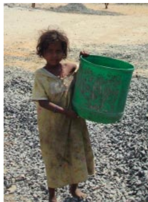
Kinderarbeit: Realität in indischen Steinbrüchen

Armut zwingt Familien oft dazu, ihre Kinder zur Arbeit statt zur Schule zu schicken. In Indien erwirtschaften Kinder rund 25% des Familieneinkommens . Laut Schätzungen gibt es in Indien heute noch 40 bis 100 Millionen Kinderarbeiter ! Sie schufteten in Fabriken und Haushalten, auf Müllhalden und in der Landwirtschaft – ohne Rechte, ohne Schutz. Ein großer Teil der Kinderarbeiter hat nicht die Chance, eine Schule zu besuchen. Dabei ist Kinderarbeit in Indien gesetzlich verboten. Die indische Regierung hat 1986 und 2006 Gesetze erlassen, die gefährliche Arbeit in Steinbrüchen und Fabriken, und später auch in Haushalten, Restaurants und Hotels für Kinder unter 14 Jahren verbieten. Doch diese werden nicht konsequent befolgt, so lange viele Familien auf das noch so geringe Einkommen ihrer Kinder angewiesen sind und andere gut an den billigen Arbeitskräften verdienen. Immer wieder schockieren Berichte, dass Eltern ihre Kinder in größter Not verkaufen. Die