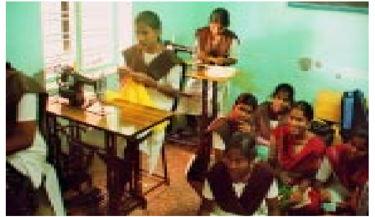
Junge Mädchen lernen nähen

abzutragen. Ganz zu schweigen von Kinderprostitution oder Drogenschmuggel: Das ist keine Kinderarbeit, das sind Verbrechen an Kindern!