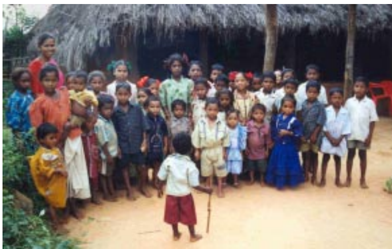
Kinder vor ihrer Dorfschule

Ort und auch für uns einen hohen Verwaltungsaufwand. Die Kosten, die hier entstehen würden, setzen wir lieber ein, um Kindern durch integrierte Projekte zu helfen.