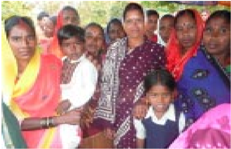
Diese Frauen sind entschlossen, die Zukunft ihrer Kinder zu verbessern

Kinderarbeit ist im südindischen Bundesstaat Karnataka heute immer noch weit verbreitet. Armutbedingt sind viele Familien, insbesondere der Dalits (Kastenlosen) und Angehörige unterer Kasten, auf ein zusätzliches Einkommen ihrer Kinder angewiesen. Der Distrikt Shimoga ist eine besonders benachteiligte Region. Durch zunehmende Dürre sind