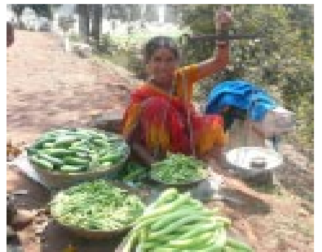
Eigene Ernte: Verkauf am Straßenrand

nisch veränderten Pflanzen eine Rolle. Bei Kauf des Saatgutes fließt eine Gebühr für das Patent an den Her-