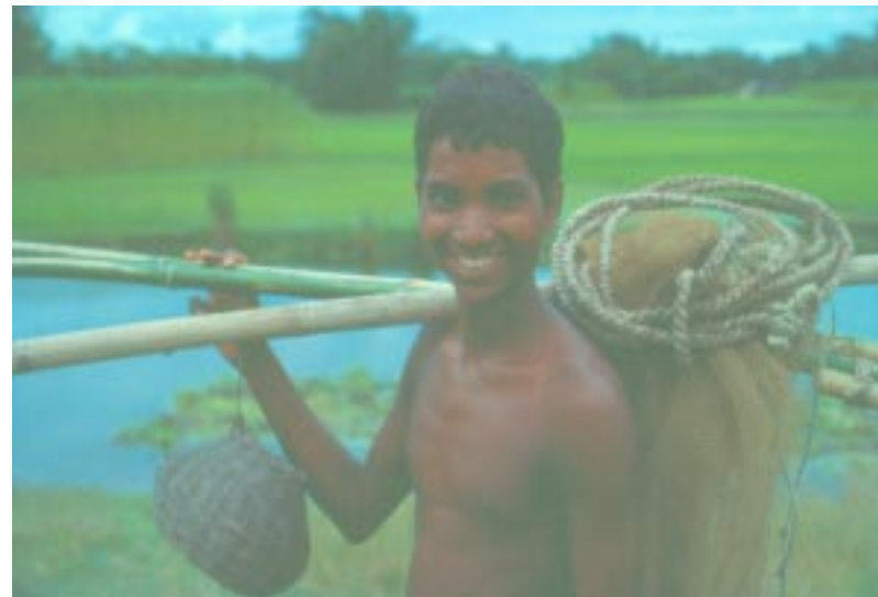
Junger Mann in Bangladesch: Seine Zukunft hängt von der nachhaltigen Ressourcennutzung ab.

Zum 60. Geburtstag der Vereinten Nationen richtet die Stadt Bonn mit der UNO und zahlreichen Organisa-