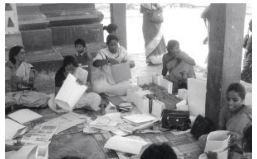
Herstellung von Papiertaschen

Chennai und umliegenden Fischerdörfern, das besonders Frauen und Kindern zu Gute kommt. Sie bietet Ausbildungskurse für Frauen und junge Mädchen zur Herstellung von Papiertaschen, Papierbedruckung, zum Flechten von Schuhen, zur Seifen- und Räucherstäbchenherstellung an. Diese Produkte haben gute Absatzmöglichkeiten in der Großstadt Chennai. Schon während der ersten Ausbildungstage konnten die Frauen und Mädchen einen Verdienst erwirtschaften. Außerdem erhalten einige Frauen ein kleines Startkapital, um sich selbstständig zu machen. Da nach dem Tsunami die Fischerei zunächst lahm lag, war plötzlich das von den Frauen erwirtschaftete Einkommen sehr bedeutsam für das Überleben der Familien und ihr