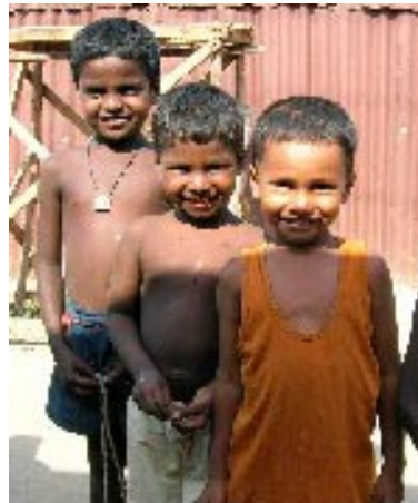
Kinder im Tsunami-Gebiet

Wir, die Kinder aus fünf Dörfern in Nagapattinam, grüßen Sie alle und danken herzlich für Ihre große Hilfe, die rechtzeitig nach dem Tsunami kam. Trotz der Killerwelle, die unsere Dörfer traf und viele Freunde und Eltern tötete, die Boote und Häuser mit sich riss, sind wir heute wieder glücklich. Das verdanken wir jedem von Ihnen. Vielen Dank, liebe Freunde.