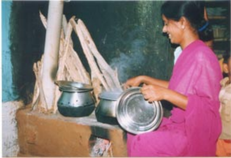
Ein rauchfreier Ofen schützt Umwelt und Gesundheit

schließt, bei einer Frauengruppe mitzumachen, die im Rahmen eines von der Andheri-Hilfe finanzierten Projektes gefördert wird, erfährt sie von anderen Möglichkeiten. Dabei geht es nicht um große technische Neuerungen, sondern um den Bau einfacher, rauchfreier Öfen. Die Baumaterialien sind lokal verfügbar. Die