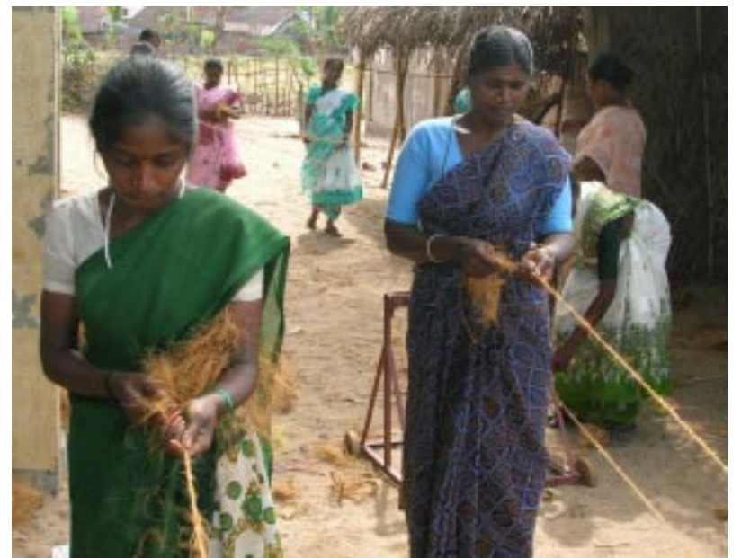
Jugendliche lernen, aus Kokosfasern Seile herzustellen

Wir sind glücklich, dass wir einer sinnvollen Arbeit nachgehen können, die den Lebensunterhalt für uns und unsere Kinder sichert. Neben den Jugend-, den Frauen – und den Kindergruppen haben wir