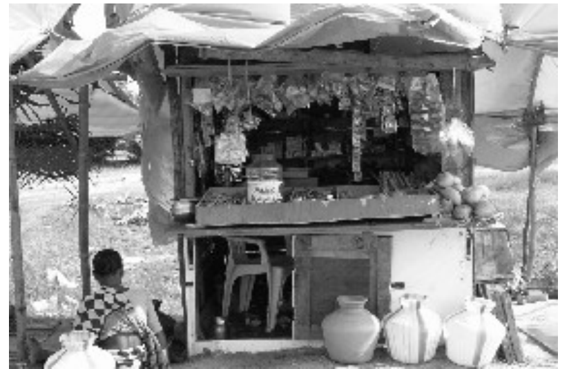
Ein kleiner Laden: Neubeginn für viele Frauen

Wir, die Frauen, die durch den Tsunami zu Witwen wurden, erhielten finanzielle Unterstützung, um einfache kleine Geschäfte zu eröffnen.