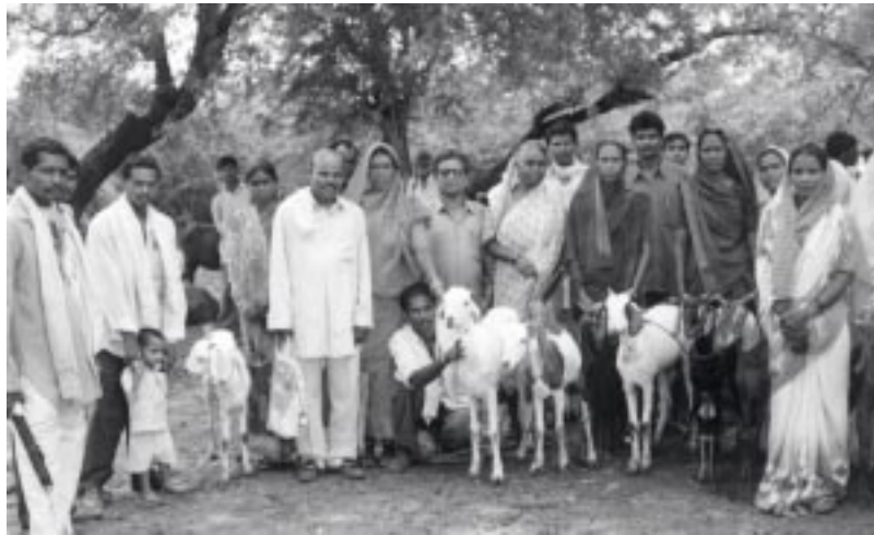
Ziegenzucht in der Hand von Frauen - die Familie profitiert

Die Erfahrung hat uns gelehrt, dass z.B. Projekte zur Verbesserung der Landwirtschaft, der Fischerei oder des Handwerks das Familieneinkommen erhöhen. Allerdings kommt dieses nicht unbedingt allen Familienmitgliedern gleichermaßen zugute. Meist liegen Produktionsmittel und Einkommen in den Händen der Männer, die leider oft eigene Prioritäten setzen. So entschieden wir uns schon früh bewusst dafür, gezielt die Frauen zu unterstützen, denn sie waren und sind es, die sich in erster Linie um Ernährung und Gesundheit der Familie, um Schul- und Berufsausbildung der Kinder kümmern. Außerdem war es uns ein Anliegen, die ärmsten, die am meisten benachteiligten Menschen zu fördern: Wieder waren wir bei den Frauen. Bei unseren Projekten ging (und geht) es uns nicht allein um die Verbesserung der wirtschaftlichen Situation – so wichtig diese auch ist. Es ging auch um soziale Veränderungen, um Anerkennung von Frauen als gleichwertige