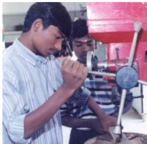
„Straßenjunge“ im Ausbildungszentrum in Cuddapah

Auch der Kampf gegen gefährliche Kinderarbeit in den Dörfern lohnt sich: bereits im ersten Jahr konnten 80 Kinder von der Kinderarbeit befreit und in die lokalen Schulen aufgenommen werden. Bis Ende 2000 sind bereits 32 der 200 Projektdörfer frei von Kinderarbeit!