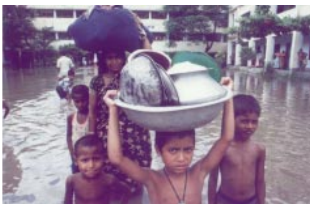
Dhaka: Letzte Habseligkeiten werden in Sicherheit gebracht

Nahrungsmitteln fehlt. Das Schlimmste ist aber die Hoffnungslosigkeit. Ernten sind vernichtet worden, Milchkühe ertrunken; die Menschen wissen nicht, wie es weiter geht!“, so un-