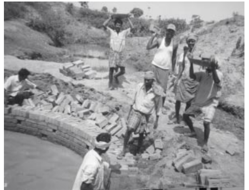
Schon während des Baus sammelt sich das Wasser im Brunnen