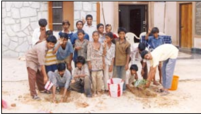
Pflanzaktion der Straßenkinder vor „ihrem“ Zentrum in Tirupathi

„Projekte fördern“ bedeutet für uns: „Menschen fördern“; mit den Menschen gemeinsam Probleme anzupacken und Lösungen umzusetzen. Etwa 400 Projekte unterstützen wir z.Z. in Indien und Bangladesch. In jedem Projekt geht es um Hunderte oder Tausende von Menschen. Wie dies möglich ist mit nur 11 Mitarbeitern (drei davon in Teilzeit beschäftigt und ein Zivildienstleistender), fragen Sie sich?