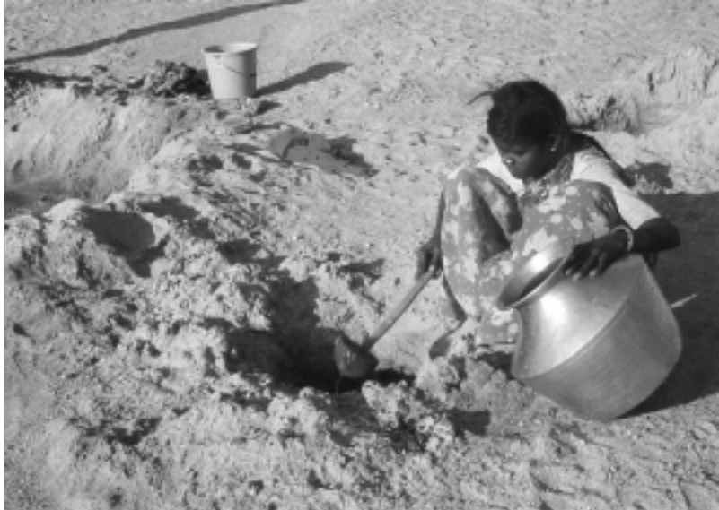
Mühsames Wassersammeln in Erdlöchern

von den Bauern oft nicht überbrückt werden. Missernten führen zu immer tieferer Verschuldung und Verarmung der Kleinbauern und die Ernteerträge decken nicht mehr den Nahrungsbedarf. Die landlosen Pächter und Tagelöhner, die als Erntehelfer arbeiten, finden keine Arbeit und müssen in die Slums der Großstädte abwandern.