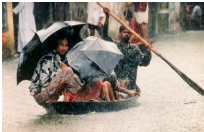
Dhaka: Land unter

ser Koordinator Shankar Costa in Bangladesch.