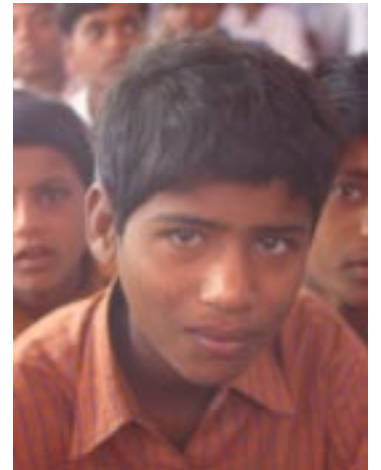
Straßenjunge in Tirupathi Was bringt die Zukunft?

In unseren Projektverträgen sind die Spielregeln festgelegt: regelmäßige Berichte müssen vorgelegt werden. Die jährlich Abrechnung muss von staatlich anerkannten Buchprüfern erstellt sein. Prüfungen der indischen Kollegen (und der indischen Behörden!) werden ergänzt durch die Prüfungen des Bundesministeriums (BMZ). Dazu kommen natürlich die Projektbesuche vor Ort: Die indischen Kollegen scheuen nie die