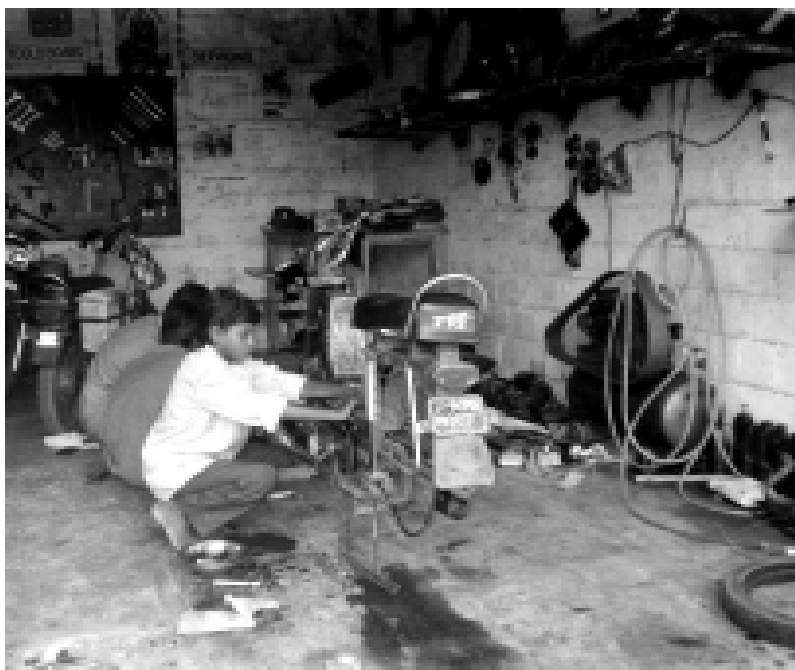
Einst Straßenkind - jetzt stolzer Besitzer einer kleinen Werkstatt

Das lange Sitzen an Webstühlen, der Staub und die viel zu schwere körperliche Arbeit im Steinbruch, der Umgang mit giftigen Substanzen in Gerbereien, Färbereien usw. verursachen oft lebenslange Schäden. Diese Kinder können nicht zur Schule gehen, ihre Talente nicht entfalten. Welche Chance haben sie dann, wenn sie mit vierzehn oder fünfzehn Jahren entlassen werden, weil jüngere Kinder billiger und gefügiger sind?