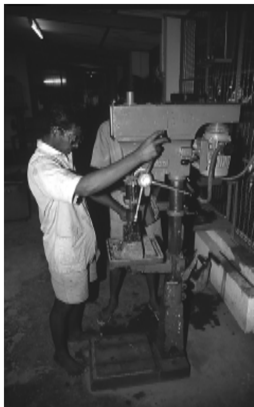
Eine gute Ausbildung sichert die Zukunft