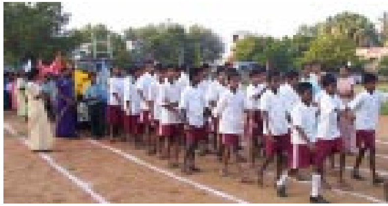
Sportveranstaltung behinderter Kinder: „Wichtig ist, dass man Erfolge vorzeigt.“

Wenn man von einer verschwindend kleinen Minderheit absieht, die in der Stadt lebt und der alle Mittel zur Verfügung stehen, kann man Folgendes sagen: Unabhängig davon, ob behinderte Menschen auf dem Land oder in der Stadt leben, ihre Lage ist erschütternd. Die Hauptursachen hierfür sind, dass (selbst gut ausgebildete) Eltern die Tatsache verkennen, dass auch behinderte Kinder über Möglichkeiten und Potenziale verfügen. Sie verbringen die Kindheit auf der Suche nach medizinischer „Heilung“ von der Behinderung. Aber sie erhalten keine vernünftige Aufklärung, Beratung oder Betreuung. Die wichtigste Entwicklungsphase der Kinder verstreicht ungenutzt und die Kinder können ihre vorhandenen Potenziale nicht entdecken und entfalten. Hinzu kommt, dass die verfügbaren Mittel zur Unterstützung von behinderten Menschen vor dem Hintergrund der riesigen Bevölkerungszahl Indiens minimal sind und die wenigen vorhandenen Ressourcen ganz überwiegend einer städtischen Elite zur Verfügung stehen. In weiten Teilen Indiens ist kaum etwas für die Behinderten getan worden. Bestehende Programme im ländlichen Raum werden zudem nicht ausreichend koordiniert und verlieren so an Wirksamkeit. Aus den genannten Gründen bleibt die Situation der behinderten Menschen unverändert. Unterm Strich bleiben sie bislang daher ein „Fluch“ für ihre Familien.