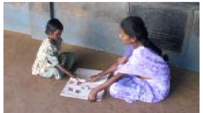
CBR-Projektmitarbeiterin mit behindertem Kind: „Das Programm endet, die Unterstützung geht weiter.“

Auf Wunsch senden wir Ihnen den Text auch gerne per Post zu.