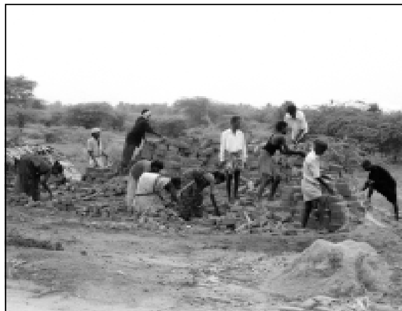
Ziegelbrennerei im Bundesstaat Tamil Nadu

zung von „HELP“ und einem Regierungsbeamten am 20. Februar 2002 befreit. Das indische Recht steht ohnehin auf ihrer Seite, wird aber oft nur auf enormen Druck von Nichtregierungsorganisationen wie „HELP“ durchgesetzt.