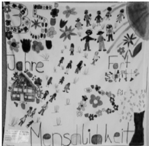
Gemalt von den behinderten Kindern

Das kommt nicht oft vor, dass Mitarbeiter der Andheri-Hilfe in Einrichtungen für behinderte Menschen gerufen werden.