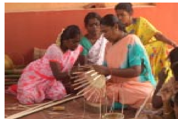
AIDS-kranke Frauen werden handwerklich geschult

jektplan zugestimmt, der sich mit einem Finanzvolumen von insgesamt ca. 50.000 Euro wichtige Ziele gesetzt hat: