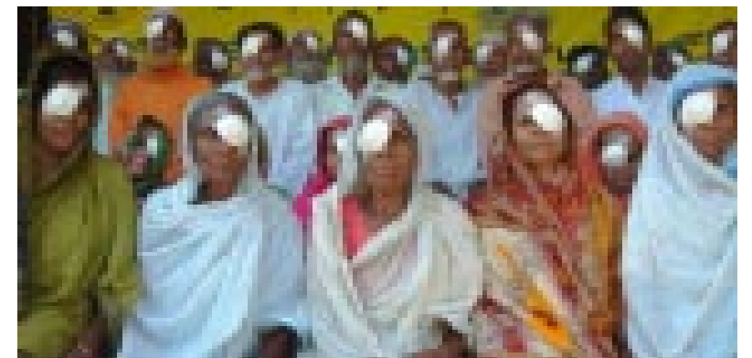
Warten auf „das Glück zu sehen“

Aus den ersten Erträgen der „ Dr. Grewal-Stiftung “ werden Gesundheitshelfer in Dörfern herangebildet. Damit wird der extrem hohen Krankheits- und Sterblichkeitsrate, besonders der Kinder, der Kampf angesagt.