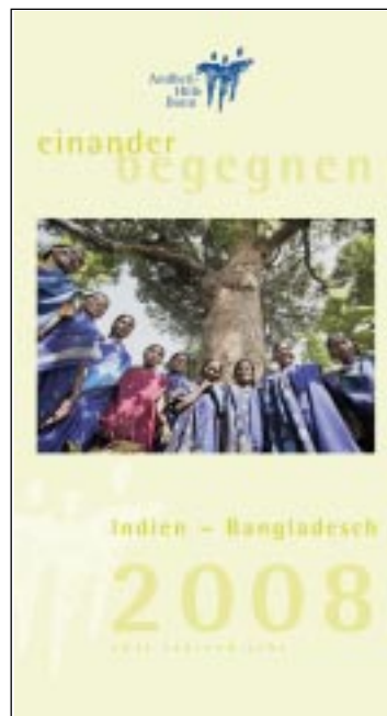
Titelseite des Kalenders 2008

20 freiwillige Läufer sind fast 100 Tage auf der über 24.000 km langen Strecke unterwegs. Sie kommen am 12. Juni nach Deutschland. Der Veranstalter, die „Blue Planet Run Foundation“ hat die Andheri-Hilfe Bonn eingeladen, an zentralen Punkten der Strecke in Deutschland ihre Arbeit im Bereich Wasserversorgung zu präsentieren. Nähere Informationen zum Streckenverlauf und zur Präsenz der Andheri-Hilfe finden Sie auf unserer Homepage. AI