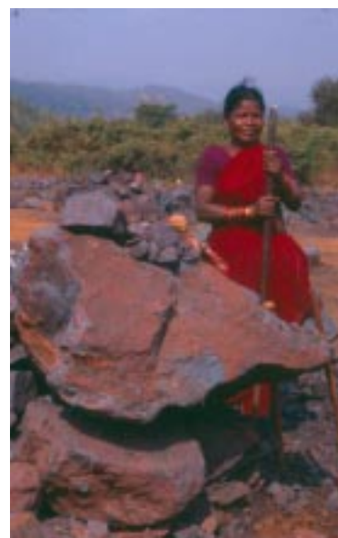
Arbeiterin in einer Eisenerzmine

In Orissa kämpfen derzeit die Adivasi (Ureinwohner) gegen eine Änderung der Landrechte. Land, das seit jeher von Adivasi besiedelt wird, gehört ihnen per Gesetz und darf selbst von ihnen nicht veräußert werden. Das Gesetz ist deshalb so restriktiv, weil ihr angestammter Lebensraum, der für die Adivasi zugleich Nahrungsquelle ist, vor Fremdbesiedlung und Zerstörung geschützt werden soll. Da viele Adivasi weder lesen noch schreiben können, haben sie ihre Landtitel jedoch oft nicht eintragen lassen. Das wird derzeit von reichen Geschäftsleuten ausgenutzt, die das Land einfach illegal besetzen. In Orissa ist das Land der Adivasi wegen der großen Bauxit- und Eisenerz Vorkommen besonders begehrt. Nationale und Internationale Konzerne möchten hier Eisenerz abbauen, um den großen Rohstoff-Hunger der wachsenden Industriestaaten zu stillen. Die Landesregierung Orissas will diesen Konzernen Eisenerzabbau ermöglichen und deshalb das Gesetz ändern. Den Adivasi soll es künftig möglich sein, ihr Land zu verkaufen. Doch diese erkennen die wirklichen Absichten hinter dem Angebot: die darauf folgende Vertrei-