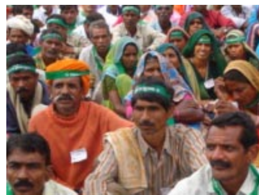
Adivasi demonstrieren für ihre Rechte

Gujarat „Adivasi Mahasabha Gujarat“ – geleitet von unserem Partner – spielte eine führende Rolle bei der politischen Lobbyarbeit zur Formulierung und Durchsetzung des neuen Gesetzes auf Bundesstaats- und nationaler Ebene. Die Verabschiedung der Gesetzesvorlage zur Anerkennung von Waldrechten durch das nationale Parlament im Dezember 2006 ist ein Meilenstein für die Stammesangehörigen sowie andere traditionelle Waldbewohner. Es ist eine entscheidende Voraussetzung zur Sicherung ihrer Lebensgrundlagen und Ernährung. Damit wurde endlich eine in der Kolonialzeit begründete Ungerechtigkeit an diesen Bevölkerungsgruppen korrigiert. Unzählige Adivasi wurden in der Vergangenheit aus ihren angestammten Waldgebieten vertrieben, sei es durch so genannte Entwicklungsprojekte wie den Bau von großen Staudämmen, den Abbau von Bodenschätzen oder die Konkurrenz durch Siedler. Oft wurden die Ureinwohner unter dem Vorwand des Naturschutzes von Forstbehörden und anderen Lobbygruppen gezwungen, ihr Land zu verlassen, nicht selten gewaltsam. Die wertvollen Waldressourcen