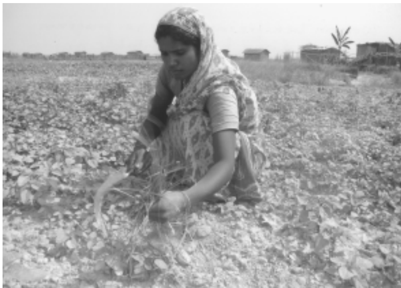
Gemüseärten sichern Einkommen und gesunde Ernährung

Neben den sechsmonatigen Ausbildungskursen werden vier Mal pro