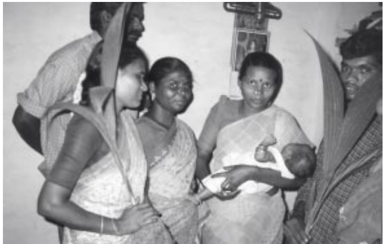
Sie darf leben!

Helfen auch Sie mit einer Spende den Frauen in Tamil Nadu bei ihrem Kampf gegen die Mädchentötung. Stichwort: „ Mädchen leben! “ UF