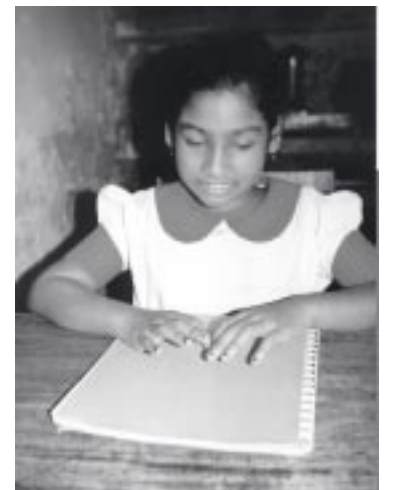
Behindertes Mädchen im Unterricht

Ein ländliches Informationszentrum ist nicht nur ein Ort, wo wichtige Informationen zum Thema Behin-