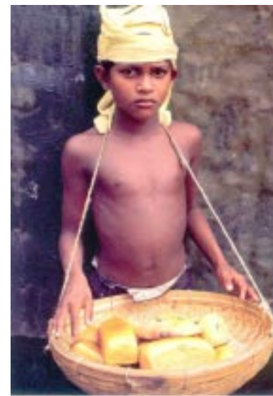
Immer noch alltäglich: Brotverkäufer

schon 1950 Kinderarbeit ächtete und später zahlreiche gesetzliche Verbote verabschiedet wurden, stellt Indien ¼ der weltweiten Kinderarbeiter. Es ist deutlich, dass die erfolgreiche Bekämpfung von Kinderarbeit nicht allein an wirtschaftliches Wachstum gekoppelt ist. Positive Beispiele aus Brasilien und China zeigen, dass neben der Armutsverringerung die Konzentration auf Bildung eine wesentliche Voraussetzung für nachhaltigen Erfolg ist. Die zuversichtliche Prognose der IAO wird ohnedies nicht überall geteilt. Zivilgesellschaftliche Organisationen halten den Optimismus des Berichts für übertrieben. Zwar ist die Lage für Kinderarbeiter unbestreitbar besser als noch vor zehn Jahren, aber die Situation in Afrika und Südasien ist weiterhin bedenklich. Außerdem blendet der Bericht die Lage von Kindern in Kriegs- und Krisengebieten weitgehend aus. Unberücksichtigt bleiben auch Untersuchungen über die Auswirkung von Globalisierungsprozessen und Liberalisierung. Nicht unbedingt hilfreich