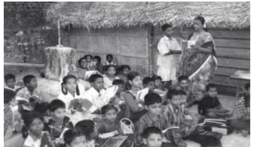
Dorfentwicklung hautnah erleben