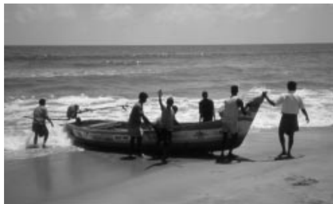
Fischer aus Kanchipuram

Wenige Monate nach der Katastrophe fahren die ersten Fischer in ihren neuen Booten zur See. Frauen finden wieder Arbeit im Fischverkauf und Kleinhandwerk. Die Kinder gehen wieder zur Schule. Viele ermutigende Erfolge sind bereits zu verzeichnen! Dank der