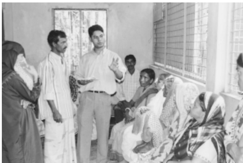
Besucher des Zentrums erhalten Tipps zur Augengesundheit

Auf der ersten Ebene bzw. Dorfebene erhalten die Dorfärzte eine Fortbildung in augenmedizinischer Grundversorgung und nach Abschluss der Fortbildung einfache Geräte, um Sehstörungen und Augenerkrankungen zu erkennen. 32 Dorfärzte und Gesundheitsmitarbeiter wurden bereits in einem Workshop über augenmedizinische Grundversorgung informiert. Die Dorfärzte sind in der Gemeinde bekannt und können sich mit den Patienten in der Lokalsprache unterhalten. Dies erleichtert die Behandlung. Es erleichtert aber auch die wichtige Aufklärungsarbeit, die von den Dorfärzten geleistet werden soll.