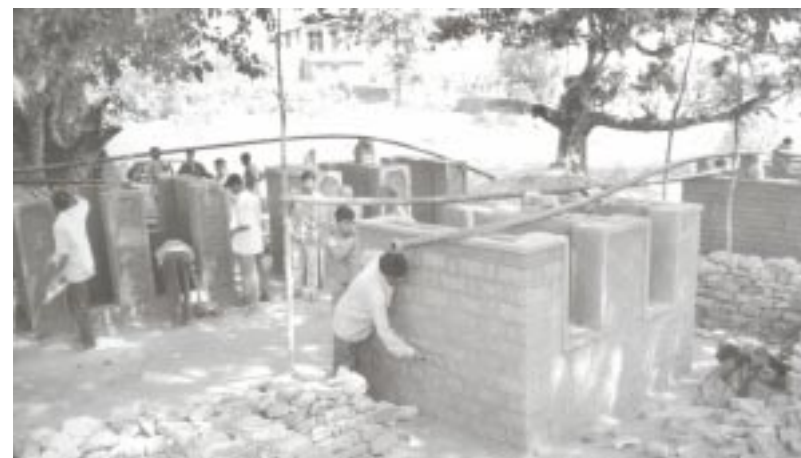
Latrinenbau in unserem Projekt in Orissa

Es wurden Wasserspeicher gebaut und eine Solarpumpe installiert, die das saubere Wasser von einer Quelle zum Speicher pumpt. Jugendliche wurden ausgebildet, die Solarpumpe instand zu halten. Jede Familie mauerte ihre eigene Toilette, denn man hatte festgestellt, dass der menschliche Kot das Wasser verseucht hatte. Zusätzlich wurde ein Fonds eingerichtet, in den jeder Dorfbewohner einen Beitrag einzahlen muss. Dieser wird später für eventu-