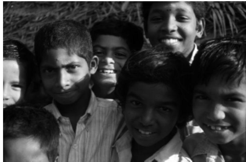
Kinder brauchen eine gesicherte Zukunft

Im Laufe der Zeit stellten wir dann aber fest, dass es auch Nachteile hat, wenn einzelne Kinder herausgehoben werden. Natürlich bedeutet eine Patenschaft Hilfe für dieses eine Mädchen – aber darüber hinaus werden schwerlich positive Veränderungen angestoßen. Im Gegenteil: manchmal kam es auch zu Neid und Missgunst der anderen Kinder, die keinen deutschen Paten hatten. Und außerdem: Welche Belastung stellte die Korrespondenz für die Heimleiterin dar. Hätte sie diese Zeit nicht besser mit den Kindern verbracht?