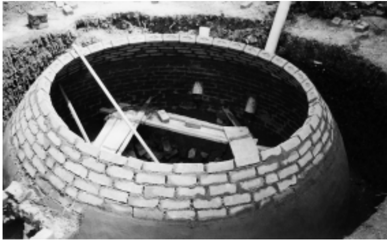
Bau einer Biogasanlage in Mysore

102 Biogas-Anlagen und 500 verbesserte Kochstellen wurden in den 4 Distrikten installiert. Zusätzlich wurden während des gesamten Projektzeitraumes Aufklärungsveranstaltungen über die Vorteile umwelt-