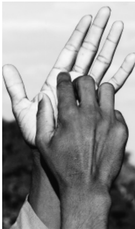
Hände sprechen

Bedienen Sie sich des nebenstehenden Bestell-Coupons oder bestellen Sie per Telefon, Fax oder per E-Mail. Die Auslieferung der Kalender erfolgt ab August.