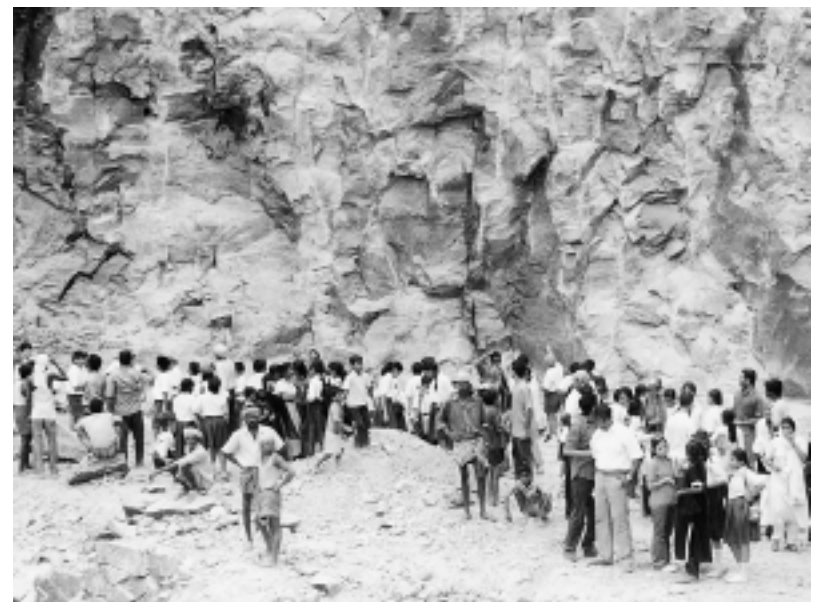
Schulkinder besuchen Kinderarbeiter im Steinbruch

Eine Evaluierung bescheinigte der ACDS Pionierarbeit mit den Familien der Steinbrucharbeiter. Gemeinsam mit der in verschiedenen Gruppen organisierten Bevölkerung wurden die Strategien für die weitere Arbeit festgelegt. Ein wichtiger Schwerpunkt der gerade angelaufenen dreijährigen Projektphase ist die Stärkung der lokalen Bürgerbewegung, damit die Bevölkerung das Bildungsprogramm eigenständig steuern kann. Den immer noch arbeitenden Kindern soll durch Bildungsangebote und Ausbildungsplätze direkt geholfen werden. Außerdem sollen Vorschulkinder aus Migrantenfamilien, die auf illegal besetztem Land leben, mit in das Programm aufgenommen werden. Zusätzlich müssen die Lebensbedingungen der Bevölkerung grundsätzlich verbessert werden, wobei die Frauengruppen eine tragende Rolle spielen. BHJ