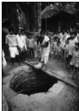
Sauberes Trinkwasser ein wichtiger Erfolg

1979 Erste Hilfsprogramme für Leprapatienten werden gefördert. Es geht um ein menschenwürdiges Leben auch für diese "Ausgesetzten", und zwar durch medizinische Versorgung in einer damals noch üblichen Langzeitbehandlung (erst seit 1984 ist Lepra durch Multi-Drug-Therapie heilbar), ferner um ihre Unterbringung in menschenwürdigen Unterkünften und soweit möglich um Verdienstmöglichkeiten für sie anstelle eines Bettlerdaseins.