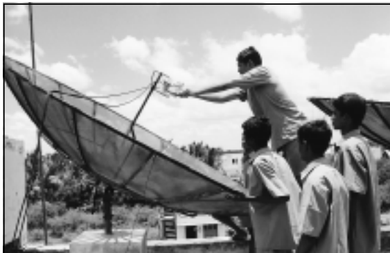
Es funkt: Azubis richten die neue Satellitenempfangsanlage ein.

netz-Kundenstamm zu einem günstigen Preis zum Verkauf an. Was noch fehlte, war die technische Ausrüstung zum Empfang der Satellitenprogramme und zu ihre Einspeisung in das Netz. Ein ungewöhnliches Projekt: Die Andheri-