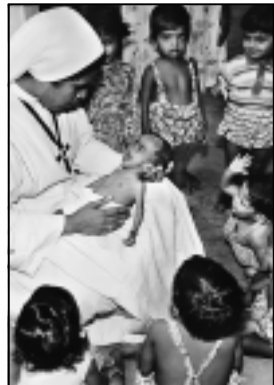
Findelkinder im St. Catherine's Home Andheri

die "Unterstützung der Kinder im St. Catherine's Home zu Andheri". 449 Spender bringen im Gründungsjahr insgesamt 171.049 DM auf.