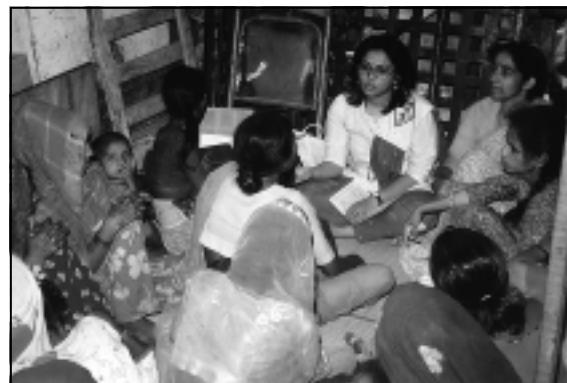
Gemeinsame Planung mit der Bevölkerung vor Ort

Ständige Offenheit für neue Herausforderungen zeichnete die Andheri-Hilfe seit den ersten Anfängen aus. Sie wird auch die Zukunft der Arbeit entscheidend bestimmen, um "Fortschritt durch mehr Menschlichkeit" zu erreichen.