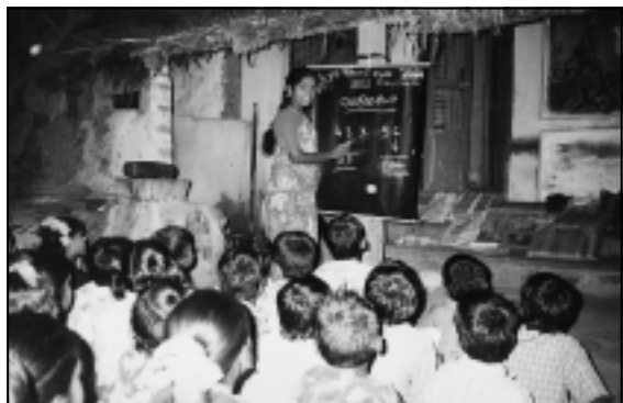
Abendunterricht für die arbeitenden Kinder

Jahre an den Kreditgeber abtreten, bis die Schuldenlast abgetragen ist. „HELP“ („Human Enlightenment Path“), eine lokale Nichtregierungsorganisation in Kancheepuram, ist seit mehreren Jahren ein tatkräftiger Partner von Andheri-Hilfe. Die Or-