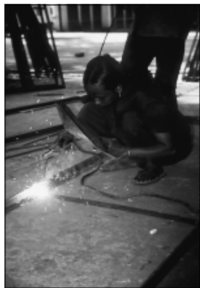
Schweißen ist nicht nur Männersache.

Die Erfahrungen mit solchen Einrichtungen in anderen Landesregionen sind ermutigend: Die Wirtschaftskraft der Familien steigt nach-