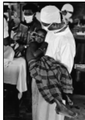
Kurz vor der Grauen-Star-Operation

fehlen Ärzte und Operationsmöglichkeiten, vor allem im ländlichen Raum. Eine einfache lichtbringende Operation kostet umgerechnet 26 DM.