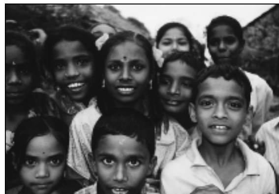
Titelfoto des Andheri-Hilfe-Kalenders 2003

Gern erwarten wir Ihre Kalenderbestellung (s. Bestell-Coupon). Planen