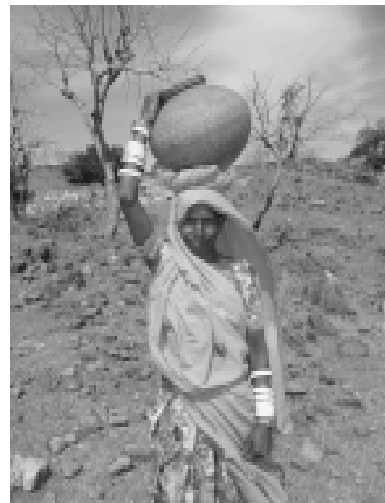
Dorfbewohnerin holt Wasser aus weiter Entfernung

noch, dass hier alles grün war. „Der Wald war so dicht, es gab so viele wilde Tiere, dass wir uns nie allein hinein trauten“, erzählt mir ein alter Mann. In wenigen Jahrzehnten hat sich die Landschaft also völlig verändert. „Seit die Straße gebaut wurde, ist alles anders geworden“, erzählen mir die Dorfbewohner. „Früher haben wir Holz für unseren eigenen Bedarf aus dem Wald geholt. Aber mit der Straße kamen auch die Holzfäller und haben ganze LKW-Ladungen abtransportiert.“ Je mehr die Abholzung zunahm, desto verheerender wurden die Spuren des seltenen aber dann umso heftigeren Monsunregens. Heute sind die Hügel von Erosion tief zerfurcht, der fruchtbare Boden wurde immer mehr weggeschwemmt, begrub dabei noch die Saat im Tal. Viele Familien haben die Dörfer verlassen oder zumindest sind die Männer auf der Suche nach Arbeit monatelang unterwegs.