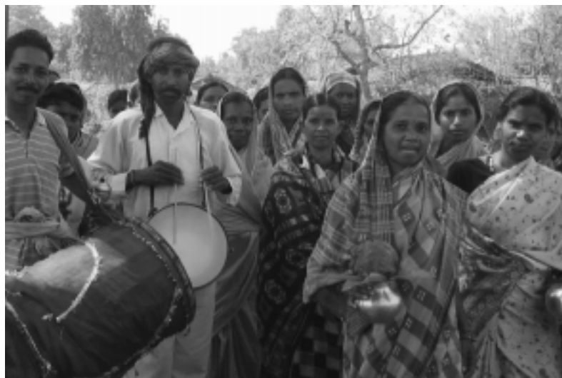
Adivasi im Dorf Duarsumi, Orissa