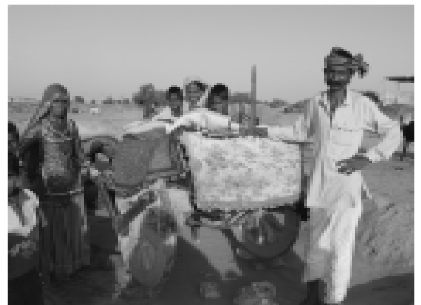
Normaden mit ihrem wenigen Hab und Gut

EG Wenn Sie diese Menschen unterstützen wollen, freuen wir uns über Ihre Spende unter dem Stichwort „Gadulia Lohar“.