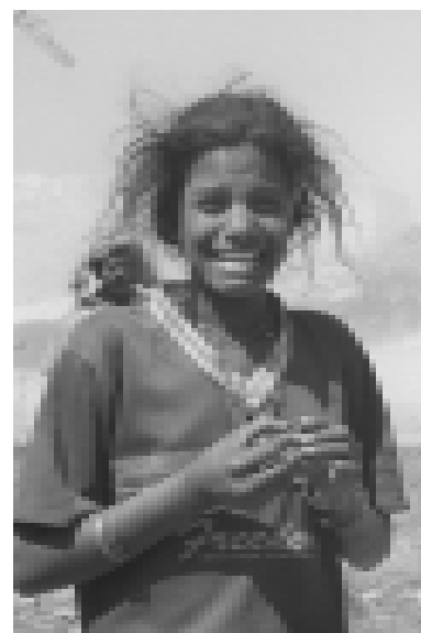
Verzweifelter Kampf ums tägliche Überleben