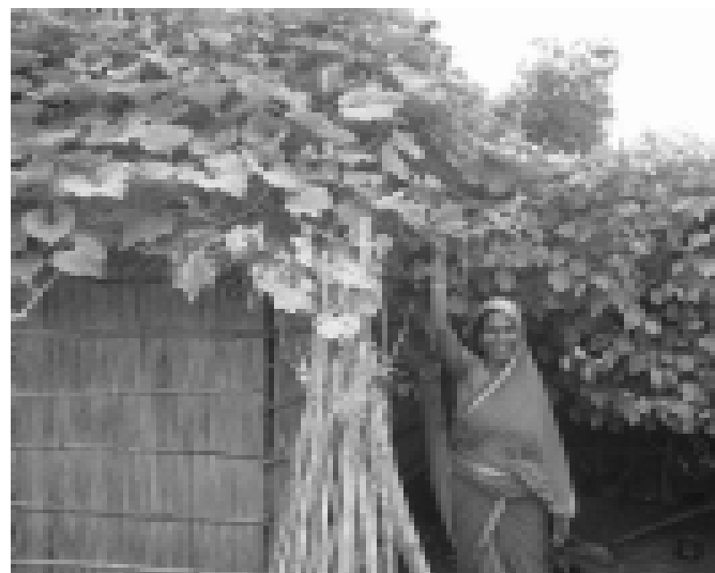
Der Garten gedeiht; das Kürbisgewächs breitet sich sogar übers Dach aus