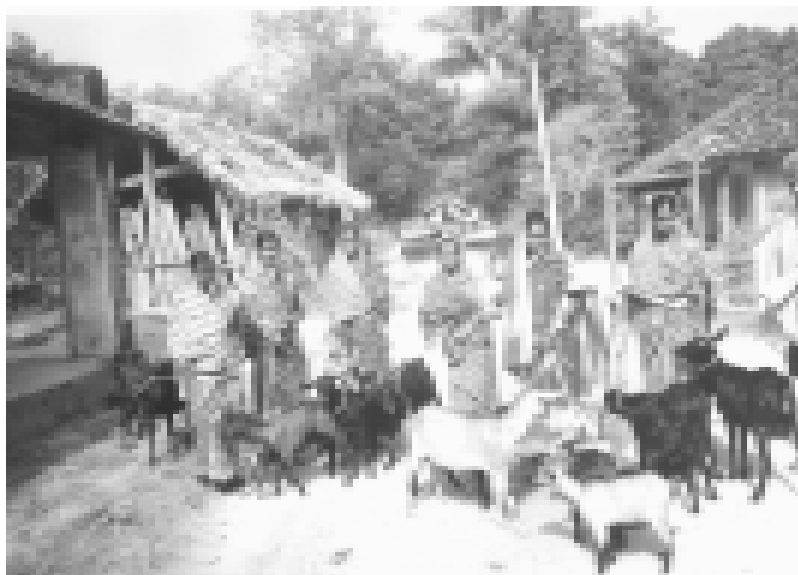
Adivasi-Frauen mit ihrer kleinen Ziegenzucht

Bitte helfen Sie uns mit Ihrer Spende. Stichwort: „Monga“