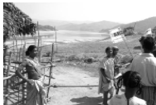
Betroffene bereiten sich auf Demonstration vor

Wenn auch Sie diese Menschen unterstützen wollen, helfen Sie uns mit einer Spende unter dem Stichwort: „ Polavaram “. Danke! EG