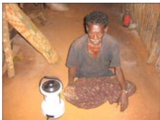
Solarlampen ermöglichen auch am Abend Aktivitäten

Um eine Solarlampe zu bekommen, müssen folgende Kriterien erfüllt sein: 1. Das Dorf ist sehr weit abgelegen und es gibt keine Elektrizität. 2. Es sind