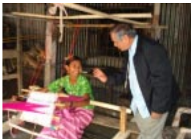
Starthilfe ermöglicht z. B. diese Anschaffung eines Webstuhls

Mit einem Betrag von 120.000 Euro konnten insgesamt 2.327 Familien, das sind über 13.000 Menschen, geholfen werden. Die Unterstützung bezog sich auf einige Dutzende unterschiedlicher Erwerbszweige, z.B.