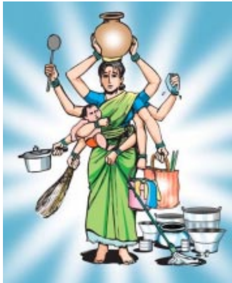
Frauen, ihr habt noch mehr Aufgaben: Kämpft um eure Rechte! (Poster CWDR)

Kampagnen hierfür eingesetzt, aber damit gerechnet, dass die Anerkennung der Haushaltshilfen als reguläre Arbeiterinnen noch weitere Zeit