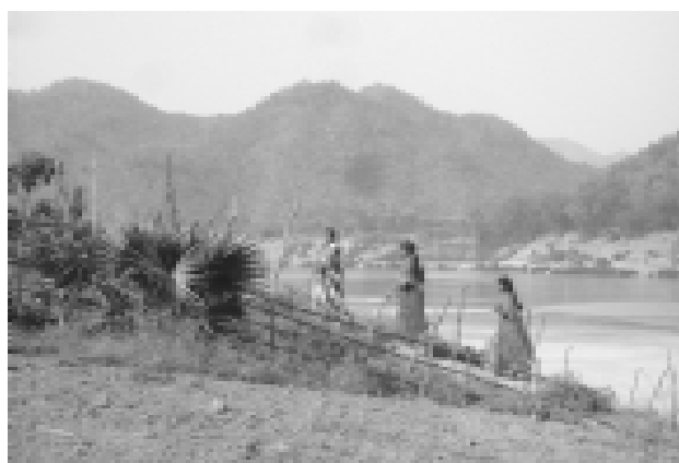
Heimat die mit dem Staudamm verloren geht

Als vor wenigen Jahren erstmals Regierungsbeamte in ihr Dorf kamen und eindrucksvolle Versprechungen machten