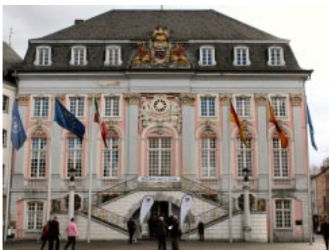
Auftaktveranstaltung im Alten Rathaus Bonn

terwürdigen Räumen, in denen schon viele berühmte Persönlichkeiten geehrt wurden, war entsprechend festlich. In ihrer Eröffnungsansprache erklärte die Oberbürgermeisterin, die „Ur-Bonner“ Andheri-Hilfe sei ein vorbildliches Beispiel für erfolgreiche Entwicklungszusammenarbeit im indischen Subkontinent.