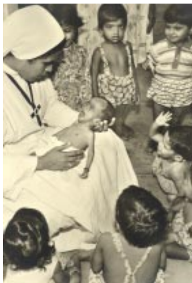
St. Catherin's Home in den 60er Jahren