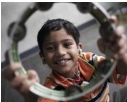
Behindertes Kind hat Zukunftschancen

Auch den Menschen mit Behinderungen gilt unsere Hilfe, und zwar nicht in isolierten Heimen, sondern als „Community based Rehabilitation“. Es geht also um intensive Einbindung ihres Umfeldes: ihrer Familien, ihrer Nachbarschaft, ihrer Dorfgemeinschaft. Besonders durch berufliche Förderung sollen diese „Menschen mit anderen Fähigkeiten“, wie unser Partner sie nennt, zu einem eigenständigen Leben finden, zu Selbstachtung und letztlich zu Respekt seitens der Gesellschaft. Auch Leprakranke schließen wir von der Förderung nicht aus: Lepra ist jetzt heilbar. Aber es geht um mehr. Unsere Fördermaßnahmen sind bestimmt von dem Ziel: Weg vom menschenunwürdigen Vegetieren auf der Straße und vom Bettlerdasein - hin zu Eigenarbeit und zu Schul- und Berufsausbildung ihrer Kinder. So wird langsam ihre Rehabilitation und Integration in die Gesellschaft, die sie einst „ausgesetzt“ hat, erreicht.