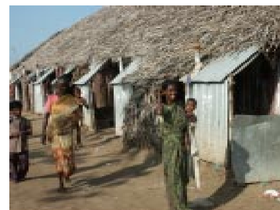
Zwei Jahre Leben in Notunterkünften nach dem Tsunami

und Einzug in das neue Dorf. Die Regierung hat das Grundstück gestellt – nur durch die nicht nachlassenden Appelle der Dalits. Als Kastenlose, Unberührbare, stehen sie nämlich ganz am Ende der sozialen Leiter in Indien. Die Fischer dagegen - viele ihrer Dörfer in unmittelbarer Meeresnähe waren ebenso betroffen - haben als Kastenangehörige den Vorrang. Nun warten hier 74 Häuser (von insgesamt