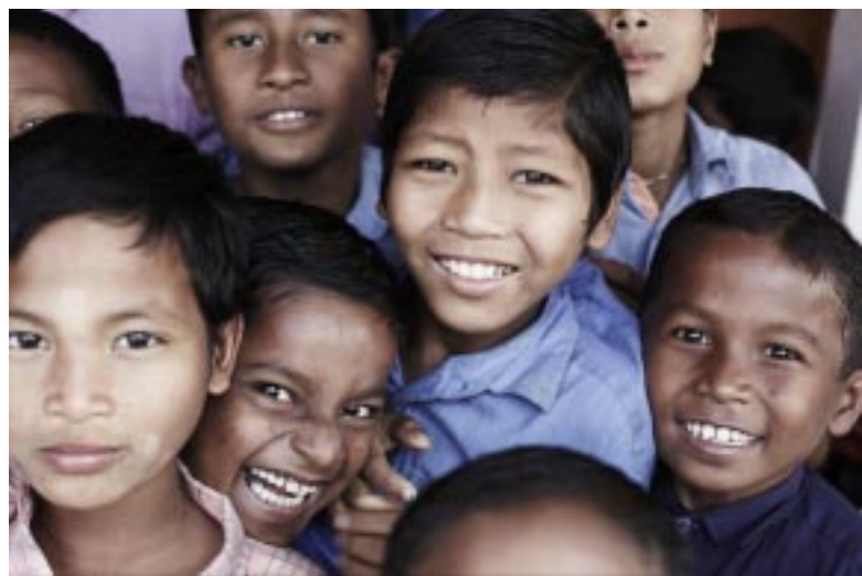
Wir wollen besser werden, damit diese Kinder eine Zukunft haben

Andheri-Hilfe betont immer wieder, eine „lernende“ Organisation zu sein. Wir lernen vor allem durch die Erfahrungen in der praktischen Projektarbeit: von unseren einheimischen Partnern, von den Menschen in den Projekten. Dabei macht jeder Mitarbeiter hier in Bonn - und jeder Kollege in Indien und Bangladesch - natürlich seine ganz individuellen Erfahrungen. Wie können wir diese zu einem gemeinsamen Lernprozess zusammen bringen?