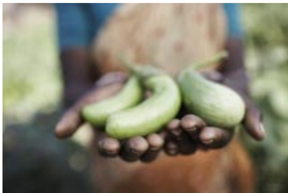
Frisch geerntete Feldfrüchte

Agrarprodukte aus dem Ausland, z.B. der EU, drängen heute auf den indischen Markt, so dass die lokalen Landwirte nicht mehr konkurrenzfähig sein können. Für Baumwolle