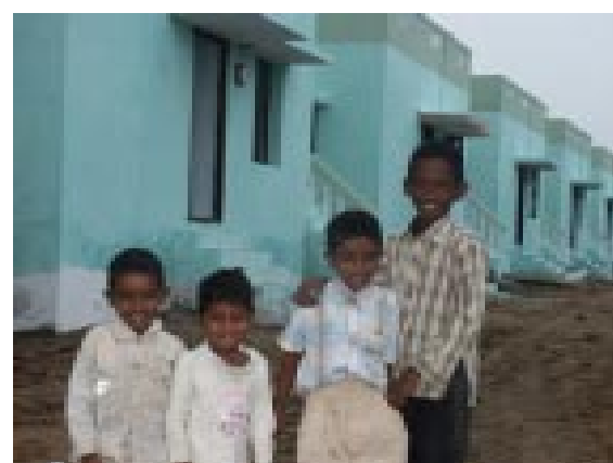
Das neue Dorf garantiert menschenwürdiges Leben

Aber es geht um mehr, vor allem um Einkommens-Chancen, die ihnen der Tsunami genommen hat. Die Felder der Reichen, auf denen sie früher als Tagelöhner arbeiteten, hat die Killerwelle total versalzen; sie liegen brach - soweit das Auge reicht. Aber mitten darin: eine Oase der Hoffnung, ein umzäuntes grünes Feld, bestellt mit Reis, Kokosnußbäumen und Bananestauden. Er gehört zu unsrem Tsunami-Projekt, dieser gelungene Versuch eines einfachen Entsalzungsverfahrens (nach holländischem Vorbild der Polder-Entsalzung). Welcher Erfolg – nicht nur, weil die Dalits unseres Dorfes jetzt wieder Arbeit und Auskommen haben, sondern als nachahmenswertes Pilotprojekt in der ganzen Region und darüber hinaus. Vor allem aber als Beweis, dass selbst unmöglich erscheinendes möglich ist, wenn Selbsthilfekräfte am Werke sind und gezielt gefördert werden.