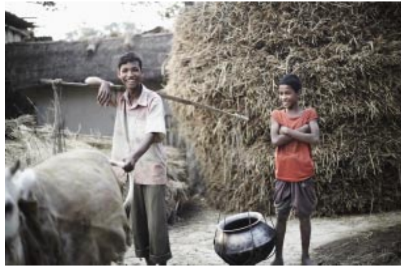
Unbeschwertes Leben im Dorf

„Die Armut verbindet alle. Wir müssen Vertrauen schaffen, damit die Menschen beginnen zusammenzu-