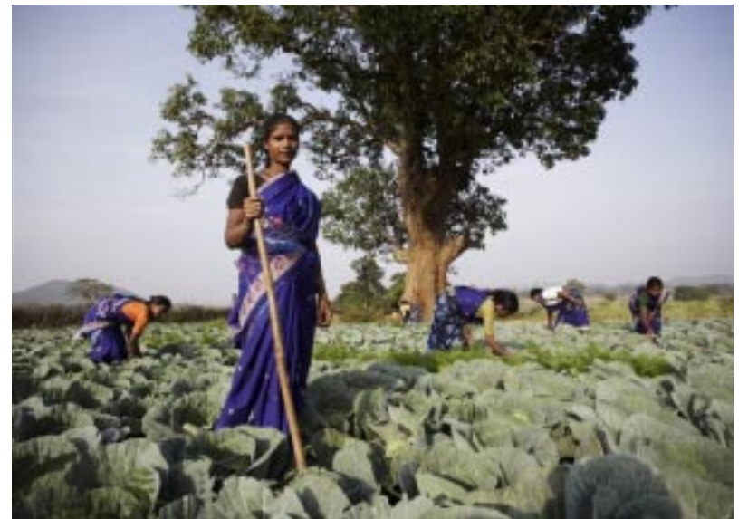
Küchengärten sorgen für vitaminreiche Kost

Die Menschen sparen regelmäßig und erhalten nach Abschluss von Trainingprogrammen einen Kredit, der nach den Erfahrungen von SERP