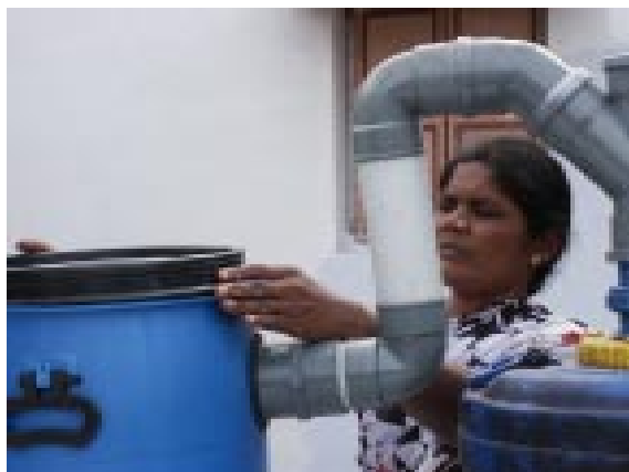
Regenwasser wird gespeichert

Aufbauarbeit zu erkennen – ausgelöst von aktiven Frauengruppen. Jetzt standen wir bewundernd vor den enormen Veränderungen für die 1.200 Bewohner von Shantipuram – finanziell unterstützt von der Andheri-Hilfe.