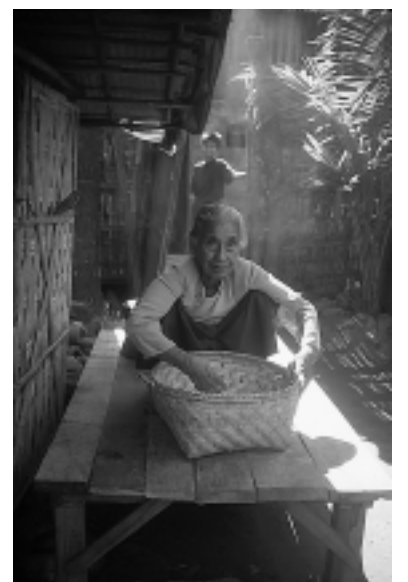
Ureinwohnerin in Bangladesch