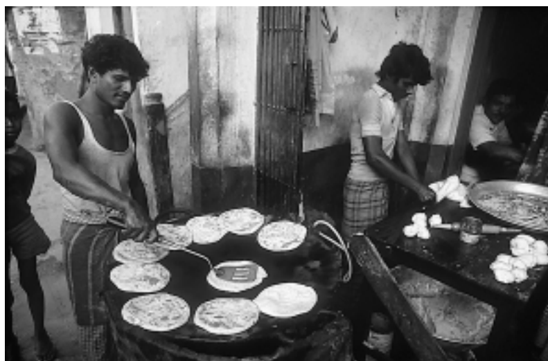
Eine Bild aus unserm Kalender 2004

Das Echo auf unseren Kalender 2004 mit dem Thema „Hände sprechen“ ist überaus positiv. Einige Restexemplare sind noch vorhanden. Sie können sie jetzt zum Sonderpreis von 3 Euro (zuzüglich Porto) bestellen – telefonisch, per E-Mail oder mit neben stehendem Bestell-Coupon!