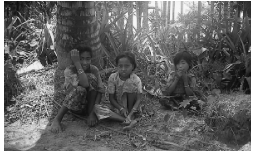
Welche Zukunft haben diese Kinder?

Zusammenarbeit mit indigenen Völkern, um Lösungen für deren Benachteiligung in den Bereichen Menschenrechte, Kultur, Umwelt, Entwicklung, Ausbildung und Gesundheit zu finden. Darüber hinaus sollte die Dekade den indigenen Völkern Möglichkeiten der Partizipation auf internationaler, nationaler und regionaler Ebene bieten. Doch die Bilanz nach 10 Jahren zeigt, dass sich die Situation für die Adivasis nicht verbessert hat. Die wirtschaftliche Entwicklung Indiens geht weiterhin gravierend zu ihren Lasten.