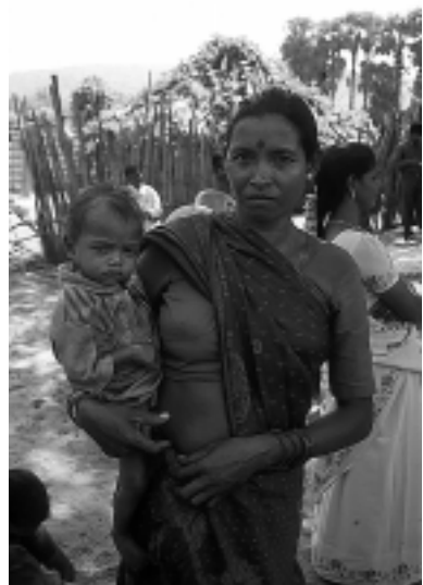
In einem Koya-Dorf in Andhra Pradesh

Zusammenarbeit mit indigenen Völkern, um Lösungen für deren Benachteiligung in den Bereichen Menschenrechte, Kultur, Umwelt, Entwicklung, Ausbildung und Gesundheit zu finden. Darüber hinaus sollte die Dekade den indigenen Völkern Möglichkeiten der Partizipation auf internationaler, nationaler und regionaler Ebene bieten. Doch die Bilanz nach 10 Jahren zeigt, dass sich die Situation für die Adivasis nicht verbessert hat. Die wirtschaftliche Entwicklung Indiens geht weiterhin gravierend zu ihren Lasten.