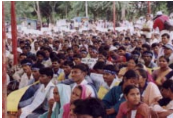
Dharna – Sitzstreik in Gandhinagar

Selbstvertrauen den Forstbeamten entgegengestellt, die sie von ihrem Land vertreiben wollten, da es angeblich zum Besitz der Forstbehörde gehöre. Mit der Unterstützung des lokalen Rechtshilfebüros unseres Partners, konnten die Dorfbewohner die notwendigen Papiere, herbeischaffen, um ihren eigenen Besitzanspruch zu belegen. Angesichts dieser Papiere und des organisierten Widerstandes der Adivasi mussten die Forstbeamten alle Einschüchterungsversuche aufgeben. Nachbardörfer folgten dem erfolgreichen Beispiel von Chikhlikor mit dem Ergebnis, das die Forstbeamten hier ebenfalls ihre Schikanen einstellen mussten.