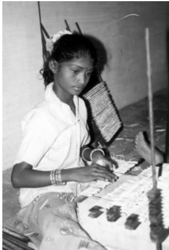
Kinderarbeit überwinden!

anstatt der angekündigten 125.000 Euro 150.000 Euro an die Andheri-Hilfe überwies. AI