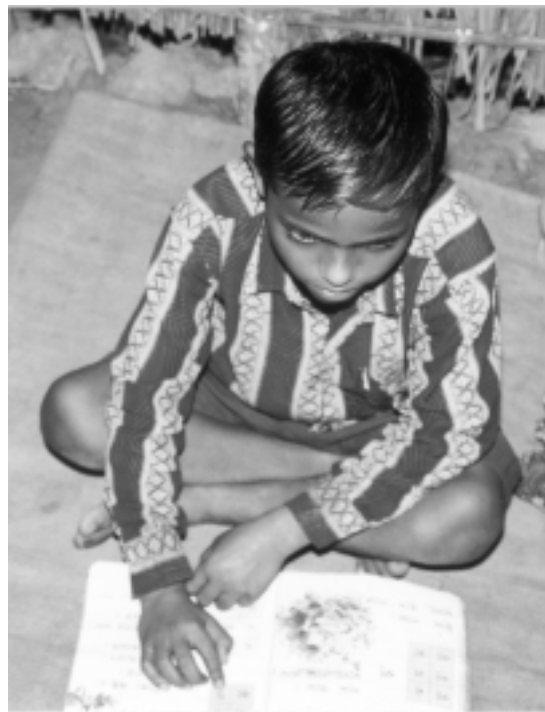
Recht auf Entwicklung – Wissen hilft!

Im Distrikt Sylhet leben über sieben Millionen Menschen. Wie viele davon mit einer Behinderung leben, ist nicht bekannt. Bekannt ist indes, dass es Anstrengungen einiger weniger Nichtregierungsorganisationen (NROen) gibt, das Schicksal der Menschen zu verbessern, z.B. durch