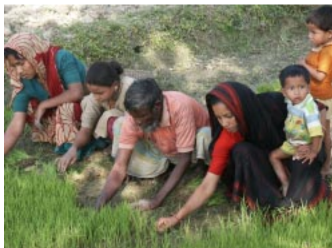
Hilfe zur Selbsthilfe - eine Augenoperation schafft neue Lebensperspektiven

chen! Suchen Sie Gleichgesinnte in Ihrem Verein, Ihrer Gemeinde, Ihrem Betrieb, an Ihrer Schule oder in der Nachbarschaft: Stellen Sie gemeinsam eine Aktion auf die Beine, damit Augen operiert werden können! Es gibt so viele Möglichkeiten, die Spaß machen und unglaubliche Hilfe bringen: vom Solidaritätsmarsch über den 24-Stunden-Tanz, vom Inliner-Rennen bis zum Straßenfest. Machen Sie anderen Menschen eine Freude – hier bei uns mit einer tollen Aktion und in Bangladesch durch das Geschenk des Augenlichtes!